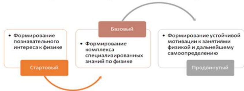
Матрица разноуровневости на примере ДООП по физике (естественнонаучная направленность)