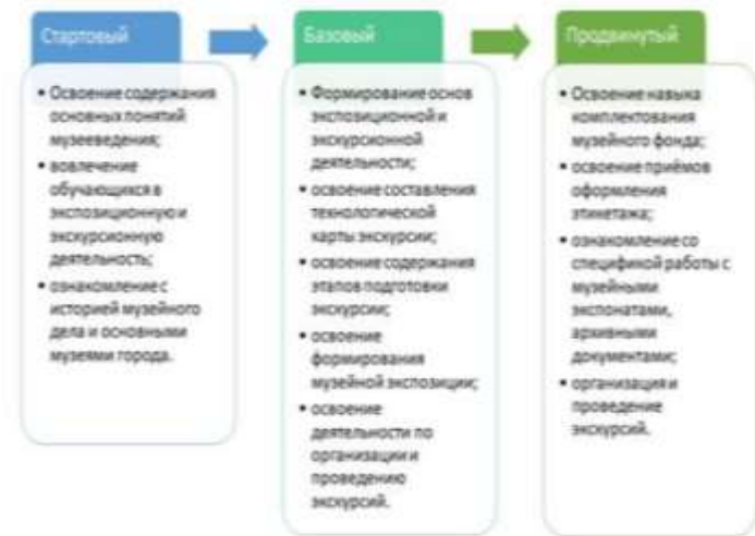
Матрица разноуровневости на примере ДООП по музееведению (туристско-краеведческая направленность)